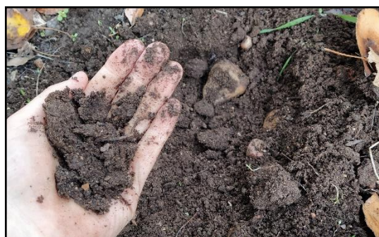
Figura 2. Compost fresco che può essere applicato nel suolo.

Possiamo verificare che il processo di compostaggio è stato portato a termine con successo quando abbiamo constatato che: si è perso l'odore sgradevole e l' odore attuale è simile a quello della terra umida , quando il colore del prodotto finale è più scuro rispetto al colore iniziale e la temperatura si è stabilizzata (Figura 2). Questa determinazione si basa su una prova fisica semplice. Tuttavia, esistono numerose prove più complesse che determinano con maggiore precisione la fine del processo di compostaggio