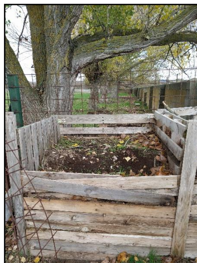
Figura 1. Compostiera fatta di pallet.

La compostiera deve disporre di un buon sistema di ventilazione e di un sistema di chiusura superiore o di copertura che eviti l'inondazione da piogge. Inoltre, conviene collocarla in un luogo facilmente accessibile e sotto un albero , affinché l'ombra dell'albero ripari il compost dal sole in estate e dal freddo in inverno.