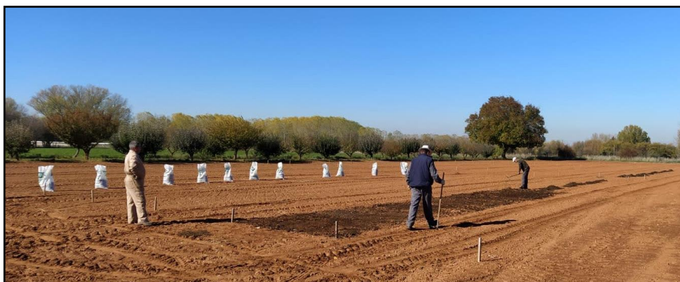
Figura 3. Applicazione del compost in un campo coltivato.

Per realizzare l'applicazione del compost è importante tener conto delle caratteristiche del terreno. Non è consigliabile applicarlo su terreni con un'elevata pendenza o in luoghi dove passa o può scorrere un corso d'acqua e dilavare tutti i nutrienti. Tali misure sono adottate al fine di evitare perdite di concime e consentire a questo di rimanere nel suolo abbastanza a lungo per nutrire adeguatamente le specie vegetali.